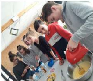
Cuisine, Gravity cake