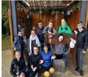
Récéré des 3 curés, sur le thème Halloween

Au mois d'octobre, c'est une quarantaine de jeunes qui ont profité des activités de la maison de la jeunesse. Nous avons retrouvé les habitués et accueilli quelques nouveaux qui ont été séduits par le surf, les jeux de défis, l'atelier cuisine, l'escape game, à Brest et la sortie à la récré des trois curés où les décors et les déguisements d'Halloween ne les ont pas laissés indifférents ! La solidarité et les encouragements de certains n'ont pas suffi à d'autres pour terminer l'effrayant labyrinthe des clowns.