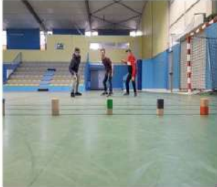
Jeux de défis, salle Guyader