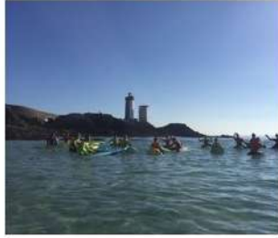
Surf, au Minou