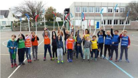
Toute l'équipe d'animation vous souhaite d'heureuses fêtes de fin d'année.

Tous les mercredis de novembre à décembre, les enfants âgés entre 3 et 11 ans ont exercé leurs cordes vocales en formant une chorale au son des tambourins, claves, et bâtons de pluie, pour accueillir, le mercredi 18 décembre, le Père-Noël et leurs parents autour d'un bon goûter confectionné par leurs soins.