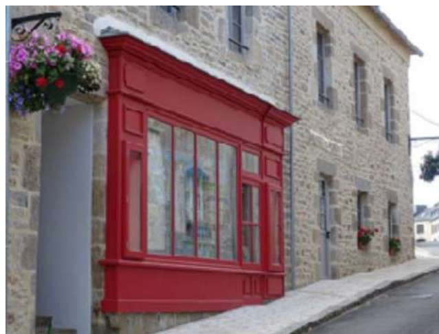
Musée du Ponant