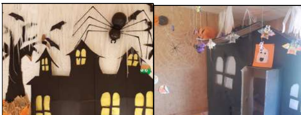
Le décor des 6-11 ans

Trois films ont été vus par les enfants du centre. Pour les plus grands : « Laurel et Hardy : premiers coups de génie » avec la célèbre bataille de la tarte à la crème, puis « Calamity » de Rémi Chayé qui a été suivi d'une rencontre avec les scénaristes. Dans le cadre du festival « les bobines de l'étrange » les plus petits ont assisté à la projection du film « Les mal-aimés », pour ne plus avoir peur des araignées ou autres petites bêtes. Certains ont même eu l'idée d'en fabriquer une pour le décor d'Halloween du centre de loisirs, et fêter le dernier jour des vacances en se déguisant. « Même pas peur ! »