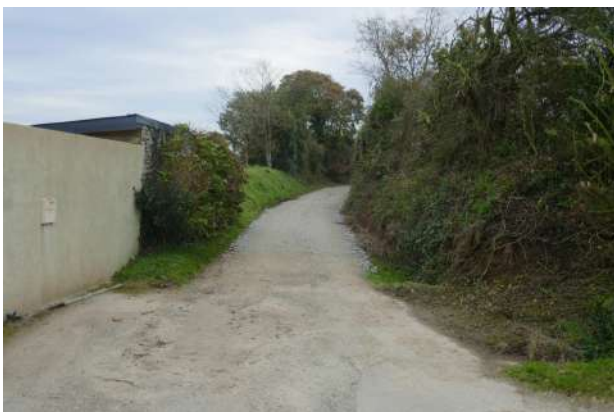
Rénovation chemin communal d'exploitation Ty Ruz / Lezvezennec