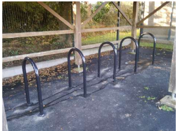
Parc à vélo à l'école du Vizac