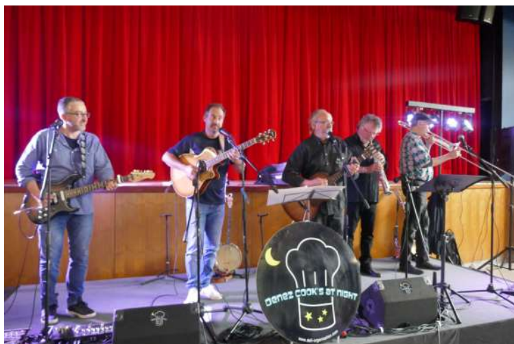
Le Groupe musical Devez Cook's at night a animé le repas