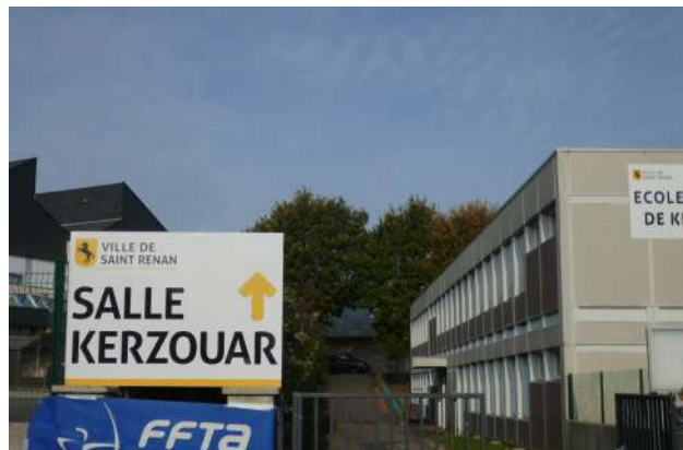
Signalisation de la salle de Kerzouar par un panneau