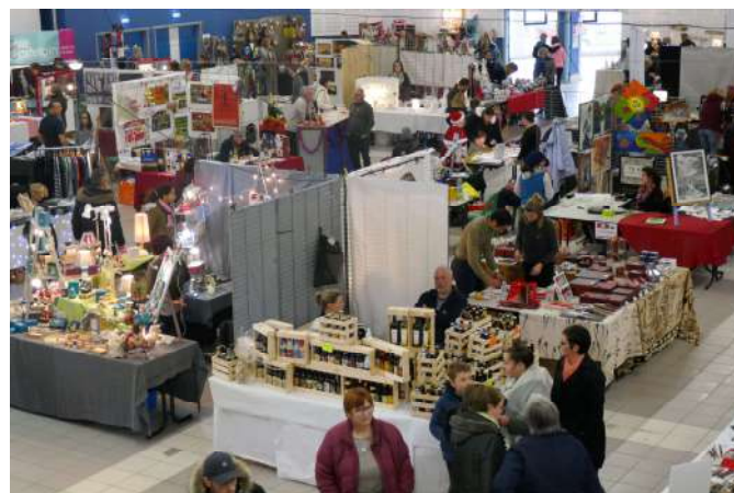
Stands du marché de Noël 2019 à l'Espace Culturel

↳ Renseignements auprès de Saint Renan Animations ☎ 02.98.84.20.08 - animations@saint-renan.fr