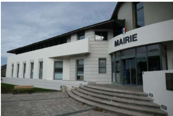
Ravalement des façades de la mairie. Travaux effectués par les agents municipaux