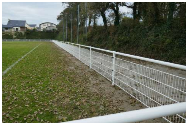
Création d'une main courante autour du terrain de rugby de Bel Air