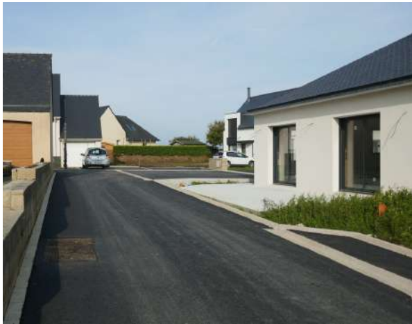
Aménagement de la rue des sabotiers dans le nouveau lotissement communal à Quillimerien