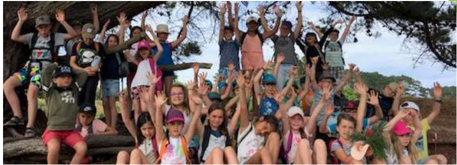
Séjour été 2019 aux Blancs Sablons

L'équipe de l'ALSH Ty Colo travaille à partir d'un projet pédagogique qui guide son action tout au long de l'année. Il se décline au sein des programmes que construit l'équipe d'animation pour chaque période et pour chaque tranche d'âge autour de cinq thématiques :