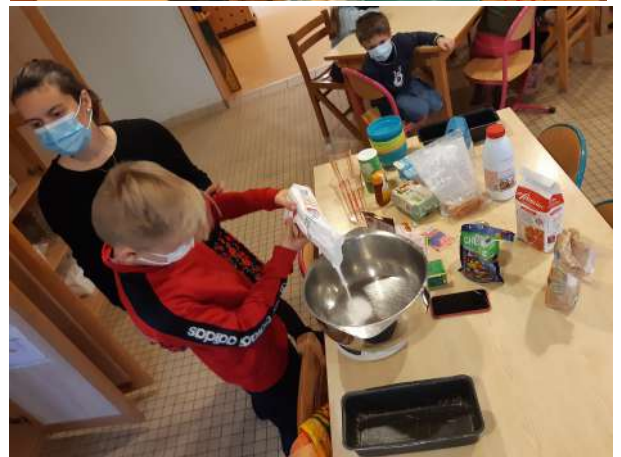
Atelier cuisine pour les plus grands