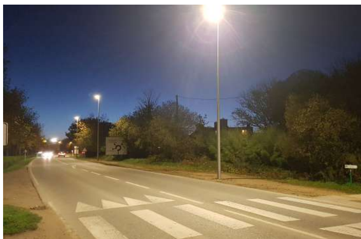
Eclairage public de Pontavenec : Sécurisation de l'entrée de la ville et du passage piétons cyclistes