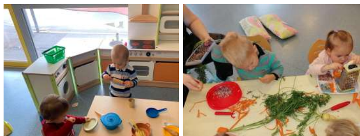
La semaine du goût

La municipalité a permis l'investissement d'un « coin cuisine » au centre de la section des plus jeunes du multi-accueil.