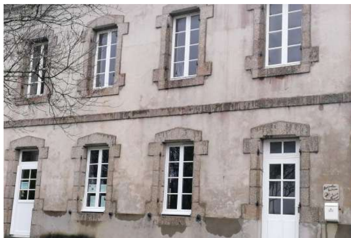
Travaux dans les écoles : changement des menuiseries à la cantine du Petit Prince et à la cantine du Vizac