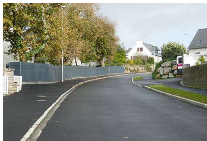
Rue Pen ar Créac'h avant / après travaux