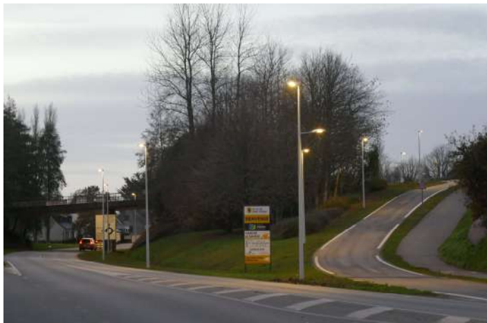
Eclairage bretelle Bd Ponant en venant de Brest