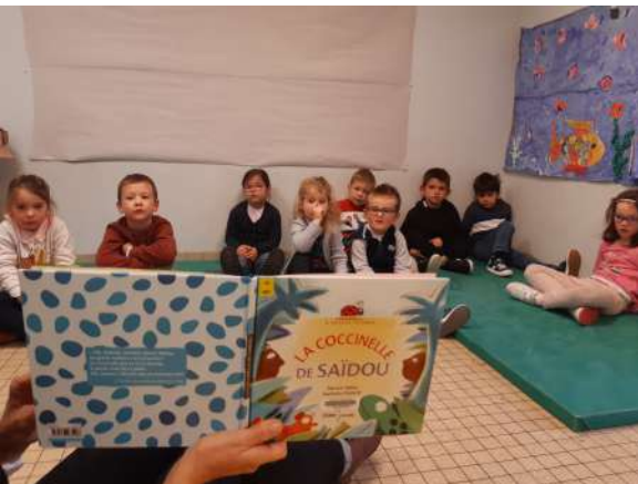
Lecture pour les plus petits avec les agents de la médiathèque