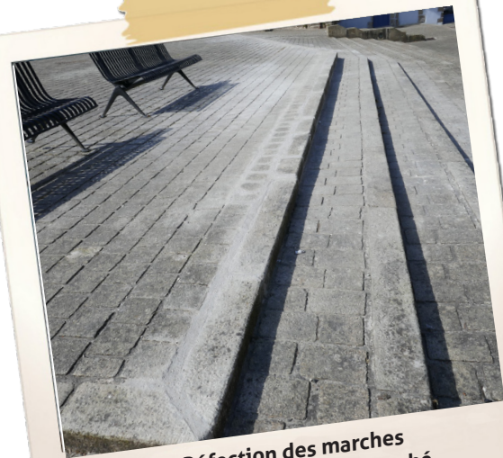
Réfection des marches de la Place du Vieux Marché