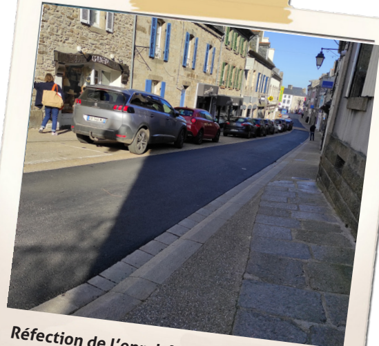
Réfection de l'enrobé de la rue Saint Yves Après les travaux