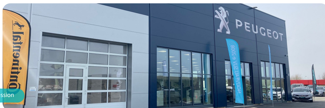
La nouvelle concession

Pour fêter l'ouverture, un cadeau offert sur simple visite.