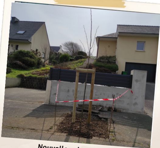
Nouvelles plantations : Giratoire de Pontavennec, Rue de Brest et Allée Park an Aber