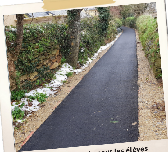
Chemin Augustin pour les élèves et les personnes à mobilité réduite