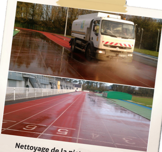
Nettoyage de la piste d'athlétisme