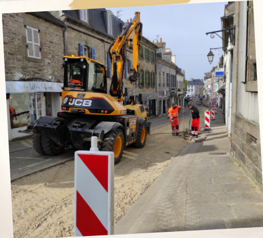
Réfection de l'enrobé de la rue Saint Yves Pendant les travaux