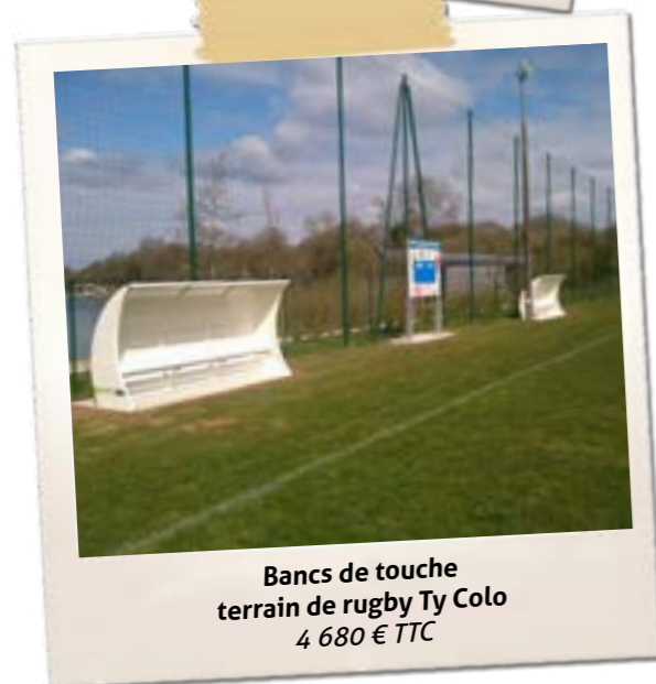
Bancs de touche terrain de rugby Ty Colo 4 680 € TTC