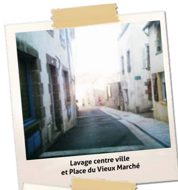
Lavage centre ville et Place du Vieux Marché