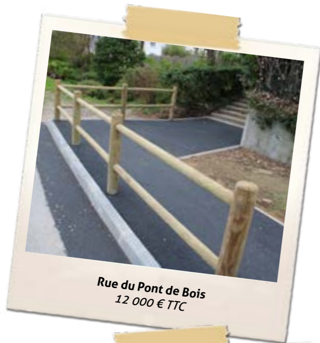
Rue du Pont de Bois 12 000 € TTC