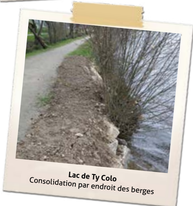
Lac de Ty Colo Consolidation par endroit des berges