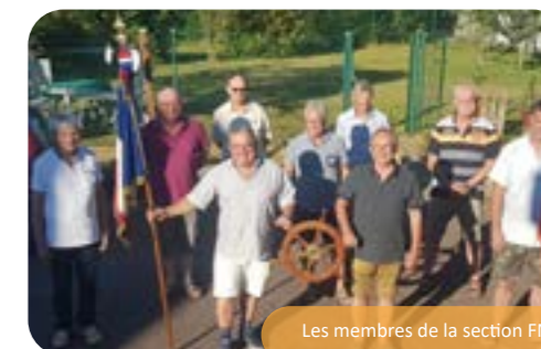
Les membres de la section FNOM

Inscrivez-vous individuellement avant le samedi 8 mai dernier délai auprès du président (06 49 23 25 21), du trésorier (02 98 84 35 49) ou du secrétaire (06 89 21 95 09) en précisant si vous souhaitez vous faire livrer. Ce sera aussi l'occasion de récupérer les timbres 2021 pour ceux qui ont réglé leur cotisation et de se mettre à jour pour ceux qui n'ont pas eu le temps de le faire.