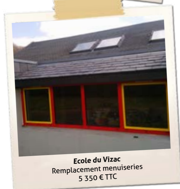
Ecole du Vizac Remplacement menuiseries 5 350 € TTC