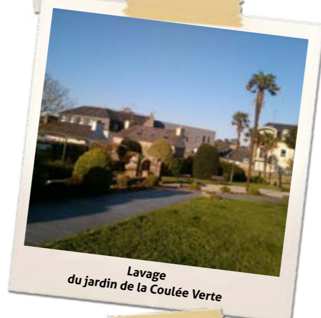
Lavage du jardin de la Coulée Verte