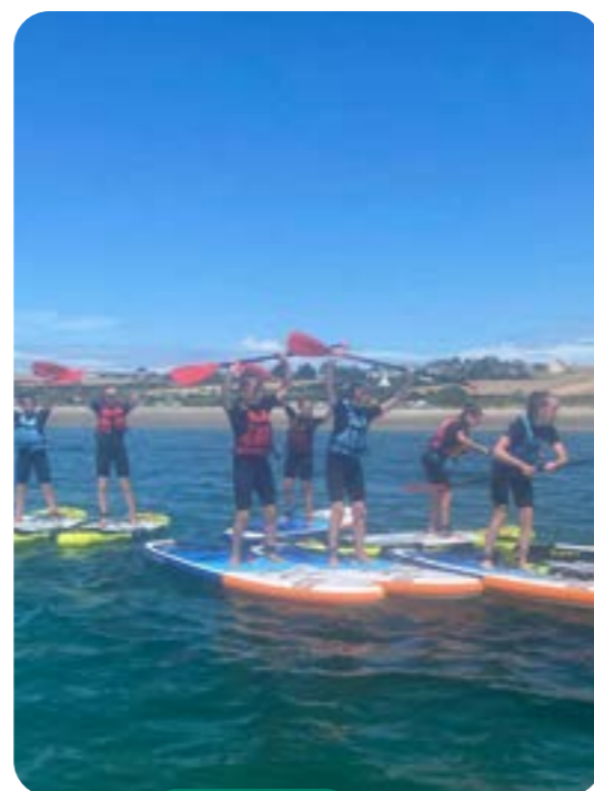
Séjour été 2020