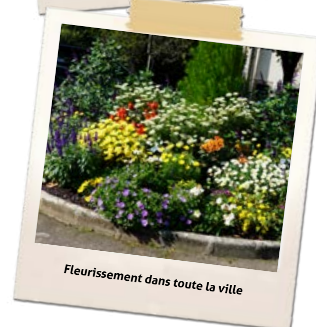
Fleurissement dans toute la ville