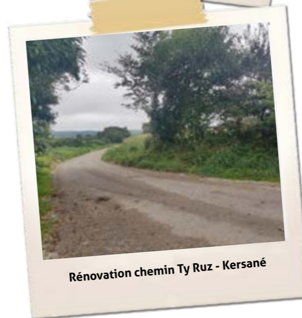
Rénovation chemin Ty Ruz - Kersané