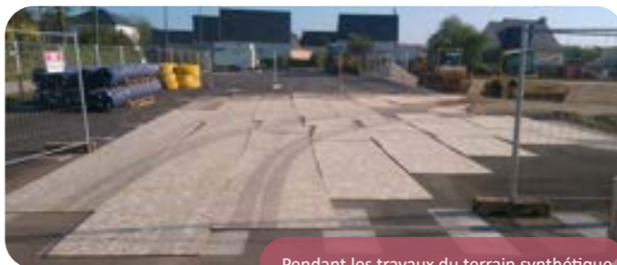
Pendant les travaux du terrain synthétique