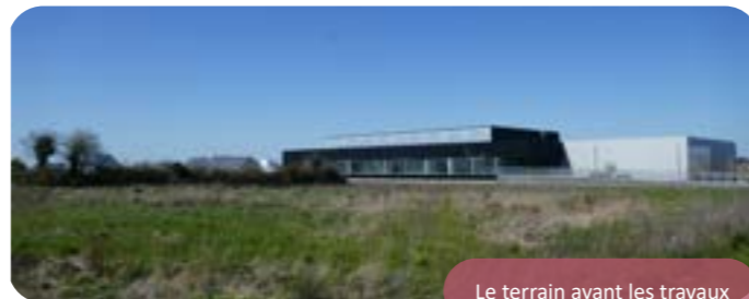
Le terrain avant les travaux

Pour la ville, c'est un facteur essentiel de développement du sport et d'attractivité au cœur du Pays d'Iroise. Un terrain en gazon synthétique a l'avantage de limiter les coûts de fonctionnement comparativement aux terrains en herbe. Son utilisation est 4 fois plus importante qu'un terrain en herbe (1200h/an en moyenne contre 300h), ce qui permet de limiter la consommation de terres agricoles. Lors des intempéries, il permet de réduire très fortement les périodes d'interdiction pour protéger les pelouses (38 arrêtés d'interdiction ont été pris en 2 ans en automne/hiver à Saint Renan).