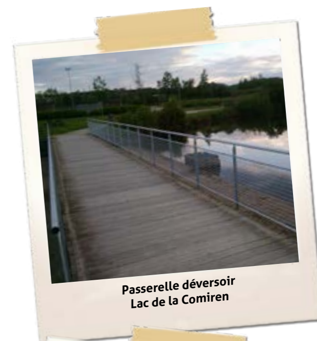
Passerelle déversoir Lac de la Comiren