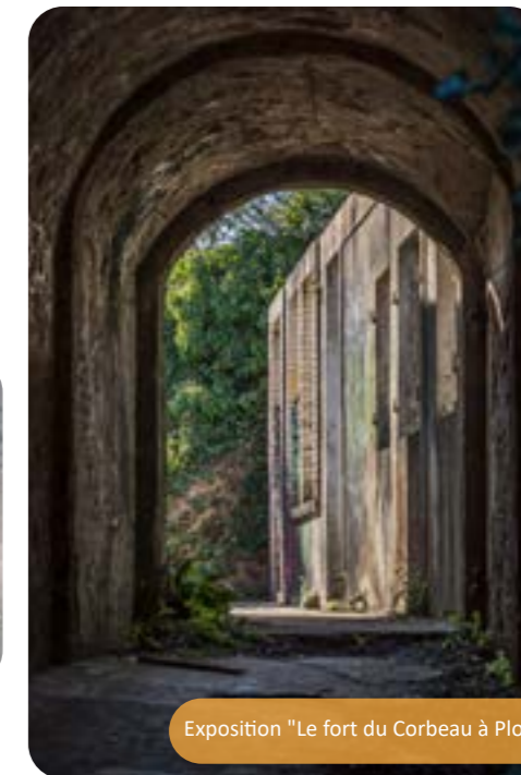
Exposition "Le fort du Corbeau à Plougastel"