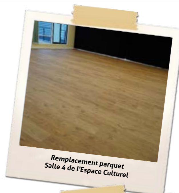
Remplacement parquet Salle 4 de l'Espace Culturel

Les agents sont également intervenus dans toutes les écoles publiques pour des peintures diverses, le nettoyage des cours et préaux, la vérification des éclairages et alarmes, le bon fonctionnement des sanitaires, la réparation des jeux et l'entretien des espaces verts.