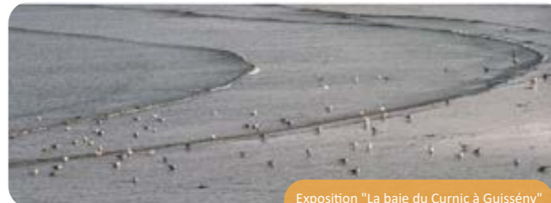
Exposition "La baie du Curnic à Guissény"

Le photo-club propose deux nouvelles expositions en septembre 2021, à la galerie Saint Yves "Le fort du Corbeau à Plougastel" et à l'Espace Culturel "La baie du Curnic à Guissény".