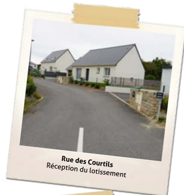
Rue des Courtils Réception du lotissement