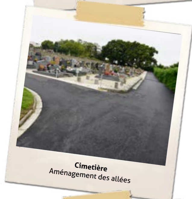
Cimetière Aménagement des allées