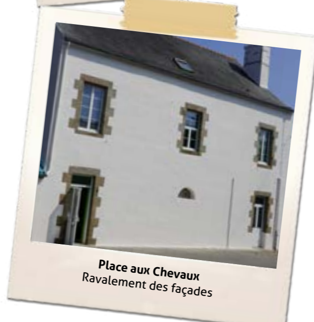
Place aux Chevaux Ravalement des façades