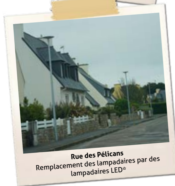
Rue des Pélicans Remplacement des lampadaires par des lampadaires LED*