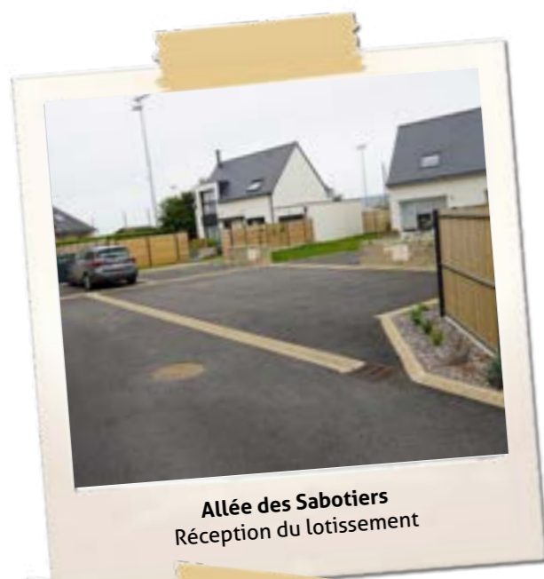
Allée des Sabotiers Réception du lotissement