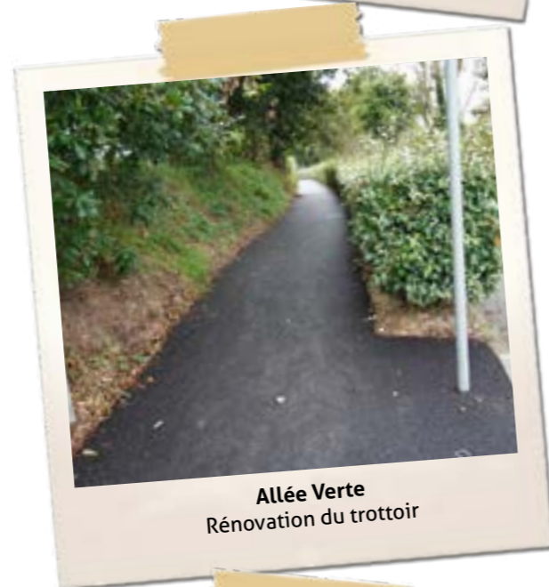
Allée Verte Rénovation du trottoir