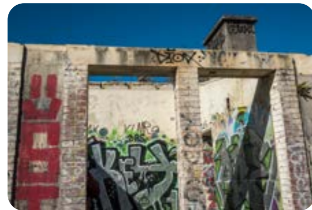
Saint Renan Actualités n°508 - octobre 2021 - P. 12

Le photo-club propose deux expositions en octobre 2021 , d'une part à la galerie Saint Yves "La baie du Curnic à Guissény", et d'autre part à la mezzanine de l'Espace Culturel "le fort du Corbeau à Plougastel". L'assemblée générale de l'association se tiendra le 8 octobre 2021 à 20h30 à l'Espace Racine salle Molière.