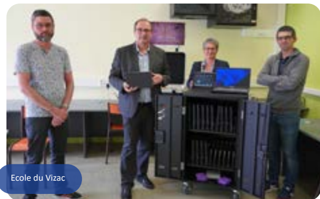
Ecole du Vizac

Soucieuse de proposer des conditions d'études, les plus favorables possibles, aux enfants fréquentant les écoles élémentaires publiques de la commune, la municipalité de Saint Renan s'est inscrite dans le plan de relance numérique porté par l'Etat afin d'équiper les écoles de nouveaux matériels informatiques. Un environnement numérique de travail a été installé dans les écoles du Petit Prince, de Kerzouar et du Vizac. Celui-ci permet de dialoguer avec les familles, de partager des contenus numériques et de disposer d'un cahier de texte virtuel pour le suivi du travail à la maison.