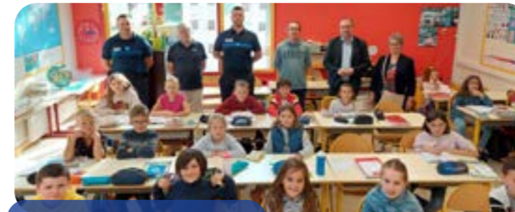
Remise du permis piéton à l'école du Vizac

Des actions de prévention sont mises en place tout au long de l'année par les policiers municipaux. Ils interviennent régulièrement auprès des écoliers pour inciter ces derniers à adopter les bons comportements dans leurs déplacements quotidiens. En partenariat avec la MAIF, ils organisent un temps de sensibilisation aux dangers de la route puis leur font passer un permis piéton qu'ils leur remettent ensuite. Le 27 juin 2022, ce sont 126 élèves des écoles élémentaires de la ville qui se sont vus remettre par M. le Maire, leur permis.