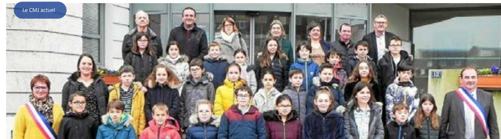
Le CMJ actuel

Le Conseil Municipal des Jeunes de Saint Renan a été créé en 2002 afin de permettre aux jeunes de s'investir dans la vie de la commune, de proposer différents projets répondant à leurs attentes et à celles de leurs camarades et de s'engager dans une démarche citoyenne. Composé de 29 enfants élus, il sera renouvelé au cours de cette année scolaire. Les prochaines élections auront lieu en janvier 2023 dans les écoles renanaises.