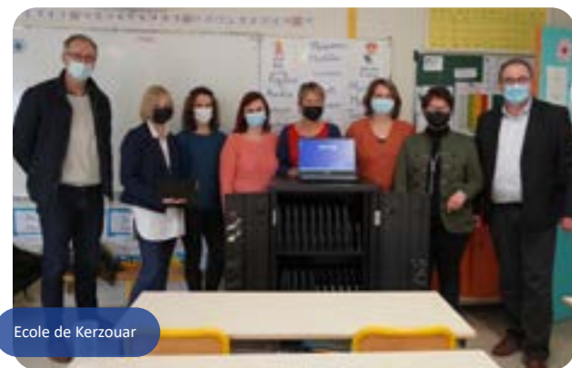
Ecole de Kerzouar