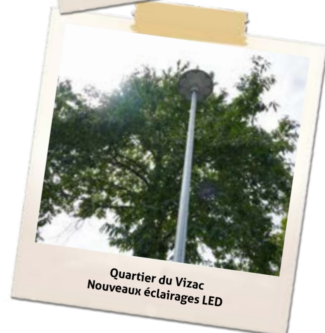
Quartier du Vizac Nouveaux éclairages LED