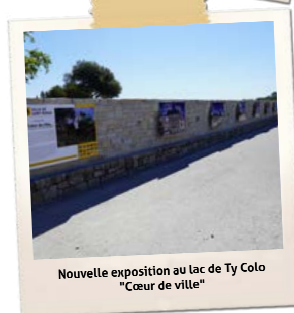
Nouvelle exposition au lac de Ty Colo "Cœur de ville"