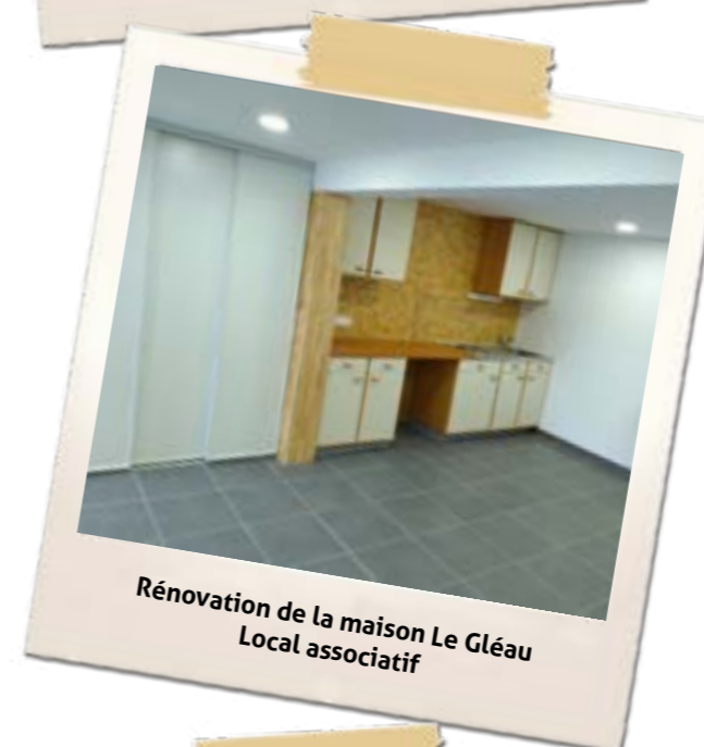
Rénovation de la maison Le Gléau Local associatif