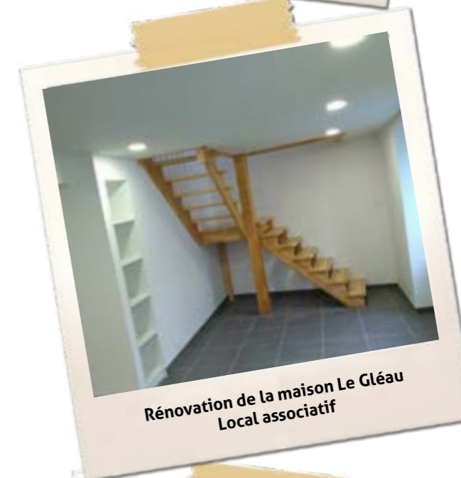
Rénovation de la maison Le Gléau Local associatif