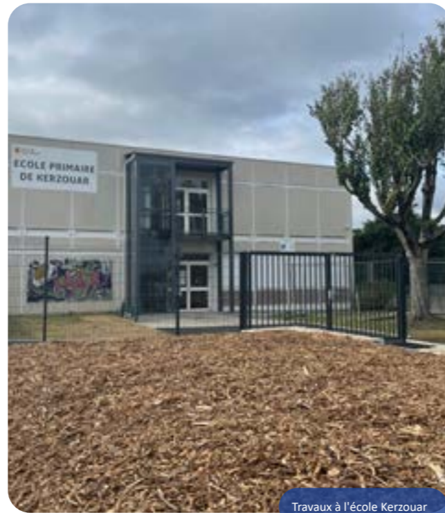
Travaux à l'école Kerzouar

Parallèlement et ainsi qu'annoncé dans le numéro de juillet-août de Saint Renan Actualités, le chantier du parvis de l'école Kerzouar a été mené à bien. Végétalisation du site, réalisation d'un grand parvis, sécurisation des circulations piétonnes et création de places de stationnement et de dépose-minute viendront simplifier et sécuriser les conditions d'accès à l'école. Ces travaux ont coûté 88 000€.