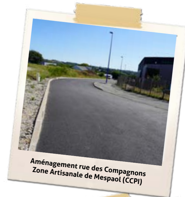
Aménagement rue des Compagnons Zone Artisanale de Mespaol (CCPI)