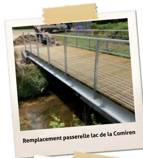
Remplacement passerelle lac de la Comiren