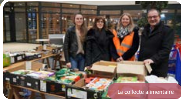
La collecte alimentaire

Comme chaque année depuis 1991 une collecte de denrées non périssables en faveur de la banque alimentaire est organisée par le CCAS en partenariat avec la CCPI.