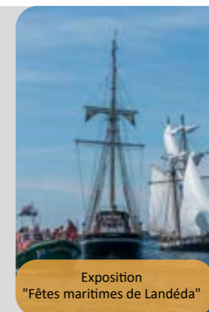
Exposition "Fêtes maritimes de Landéda"

Le Photo-club propose deux nouvelles expositions en janvier. À l'Espace Culturel du 10 janvier au 28 février , le thème proposé est "Fêtes maritimes de Landéda, Abers 2022" qui fait suite à un reportage complet sur cette animation de l'été 2022 en collaboration avec la mairie de Landéda. À la galerie Saint Yves du 10 janvier au 28 février , une exposition "photos studio" qui fait suite à des séances de prises de vues réalisées en studio dans les locaux du Photo-club.