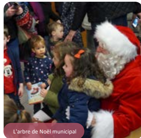
L'arbre de Noël municipal

Monsieur le Maire et l'Équipe municipale ont pu souhaiter à tous les petits Renanais et à leurs familles un joyeux Noël.