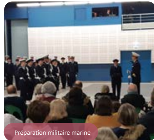
Préparation militaire marine

350 personnes étaient présentes pour assister à cette cérémonie qui s'est terminée par un moment de convivialité.