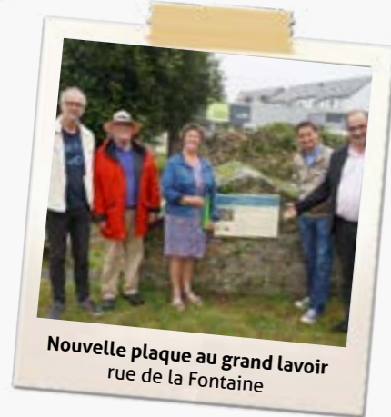
Nouvelle plaque au grand lavoir rue de la Fontaine

Des rénovations ont été effectuées sur le parvis de la piscine de Saint Renan, comprenant l'amélioration de l'étanchéité de la terrasse et le remplacement des lames en bois par des dalles en pierre artificielle de deux motifs différents. De plus, les marches ont également été remises à neuf. Les matériaux en bois récupérés ont servi en "réemploi" à rénover un ponton au lac de Ty Colo.