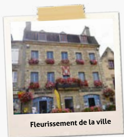
Fleurissement de la ville