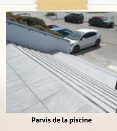
Parvis de la piscine

Des rénovations ont été effectuées sur le parvis de la piscine de Saint Renan, comprenant l'amélioration de l'étanchéité de la terrasse et le remplacement des lames en bois par des dalles en pierre artificielle de deux motifs différents. De plus, les marches ont également été remises à neuf. Les matériaux en bois récupérés ont servi en "réemploi" à rénover un ponton au lac de Ty Colo.