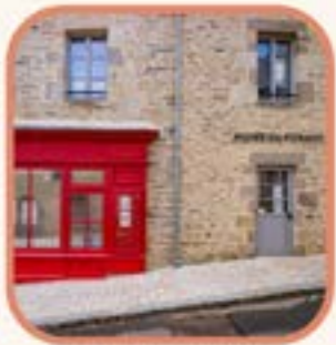
Musée du Ponant

Rétrospective sur le cyclisme : Sport de prédilection des bretons avec ses courses et ses champions.