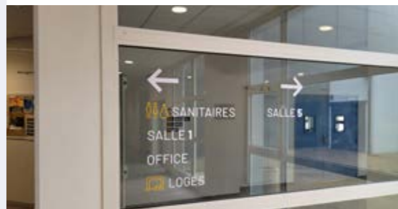
Nouvelle signalétique de l'Espace Culturel

A l'issue des travaux, une nouvelle signalétique intérieure a été installée (3 325 € HT). L'objectif étant de mieux indiquer les différentes salles et autres espaces ouverts au public.