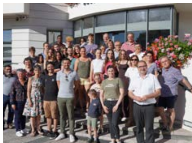
Le groupe de 43 Rochois devant la mairie avec plusieurs membres du Conseil Municipal

C'est un moment fort pour tisser des liens entre Rochois et Renanais, un échange important entre nos villes respectives de Saint Renan et La Roche sur Foron.