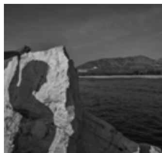
- Exposition Cadavres exquis

Le photo-club propose deux nouvelles expositions sur ses deux lieux d'exposition. A la galerie Saint Yves l'exposition "Cadavres exquis", qui s'appuie sur un jeu graphique inventé par les peintres surréalistes et qui consiste à faire une suite de réalisations par plusieurs personnes sans qu'aucune ne puisse connaître les collaborations précédentes. La seconde exposition à l'Espace Culturel s'intitule "Les jeunes du Four se font tirer le portrait".