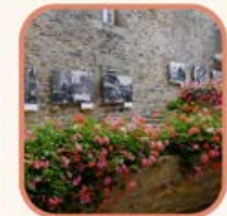
Courrette de l'ancienne mairie

A 17h : Visite guidée de la ville de Saint Renan. Départ place du Vieux Marché.