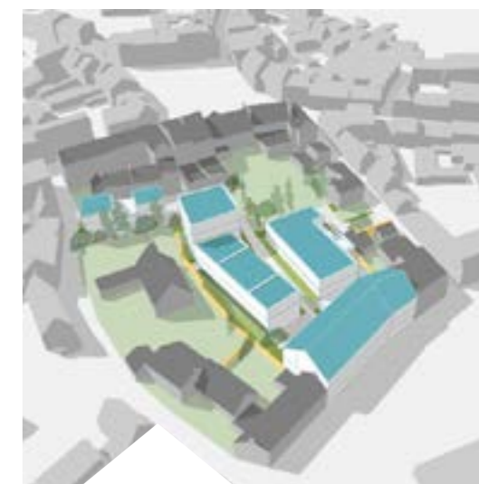
Hypothèse d'implantation des constructions