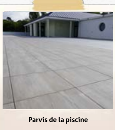
Parvis de la piscine