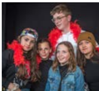
- Exposition Jeunes du Four