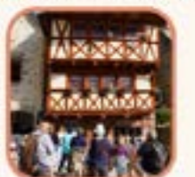
Place du Vieux Marché

Exposition en plein air à la Prairie Bleue : l'histoire de la compagnie minière.