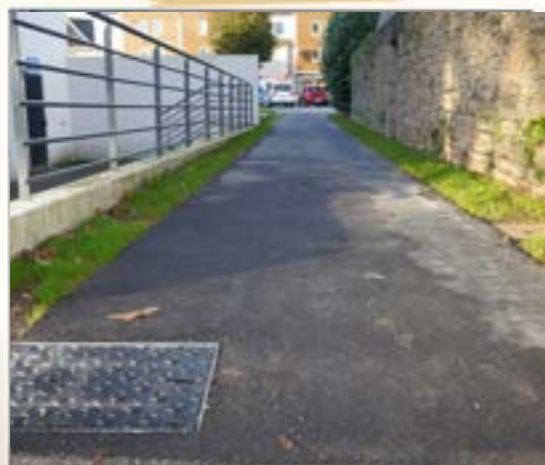
PASSAGE ENTRE LES PLACES LÉON CHEMINANT ET GUYADER Réfection de l'allée