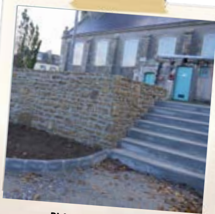
PLACE AUTOUR DU MONUMENT AUX MORTS