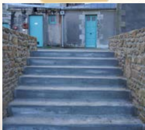
PLACE AUTOUR DU MONUMENT AUX MORTS

Saint Renan investit pour la mémoire des combattants morts pour la France.