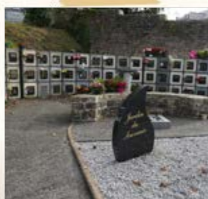
CIMETIÈRE Pour un accueil agréable des familles à la Toussaint