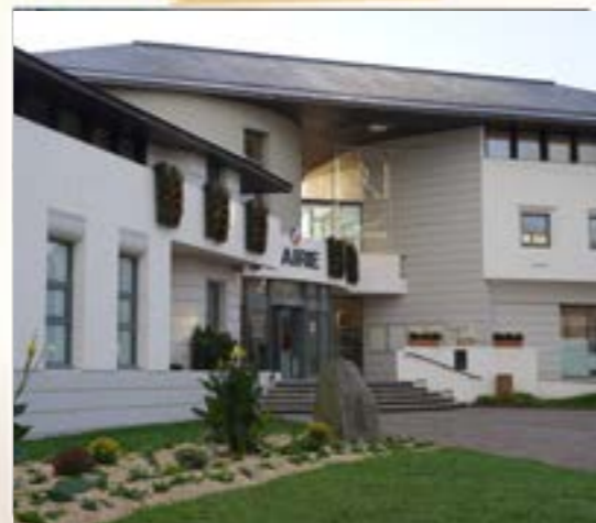
MAIRIE DE SAINT RENAN Fleurissement d'automne