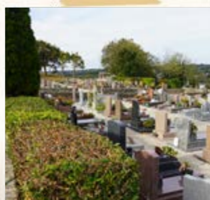
CIMETIÈRE Préparation des espaces verts pour la Toussaint