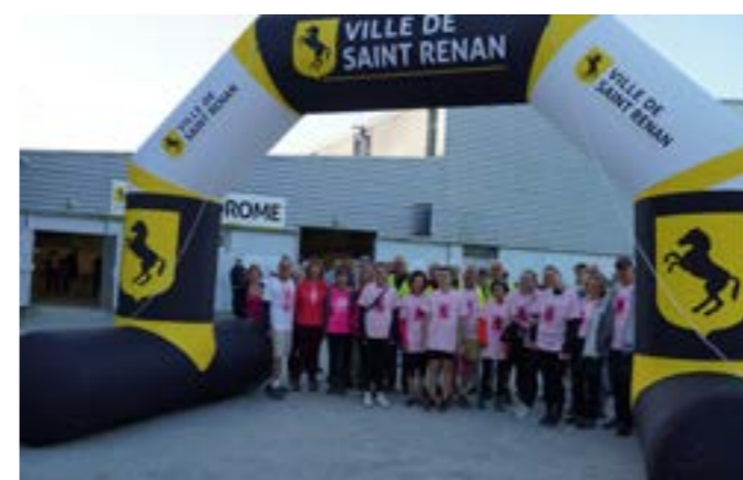
Départ de la marche rose

Pour la deuxième année consécutive et dans le cadre d'Octobre Rose, le comité d'organisation Marche Rose Saint Renan a organisé une marche (6 et 9 km) dimanche 8 octobre au départ du boulo-drome, Place Guyader. 540 personnes ont participé à l'un des deux circuits proposés.