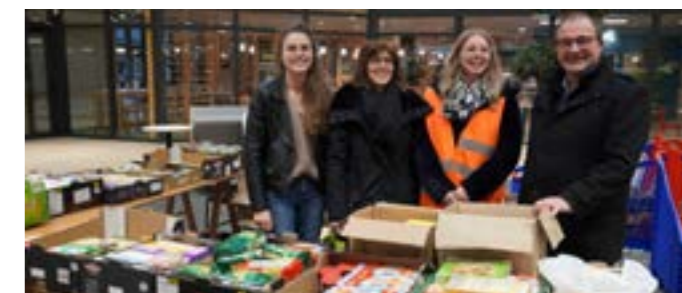
La collecte pour la banque alimentaire en 2022

Tout au long de l'année et en fonction des besoins repérés dans les communes, la C.C.P.I. en collaboration avec les Centres Communaux d'Action Sociale, distribuera les denrées collectées aux habitants dans le besoin.