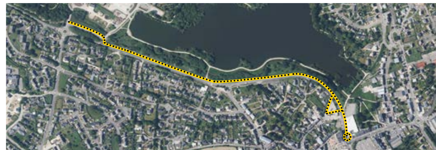
●●● Zone des travaux

Ces travaux seront suivis, dans un second temps, de la rénovation de la RD 27, par le Conseil départemental du Finistère à partir du rond-point de la rue d'Alsace jusqu'au garage Madoc.