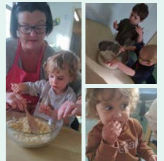
La semaine du goût

SAINT RENAN ACTUALITÉS N°531 - NOVEMBRE 2023 | Jeunesse et crèche