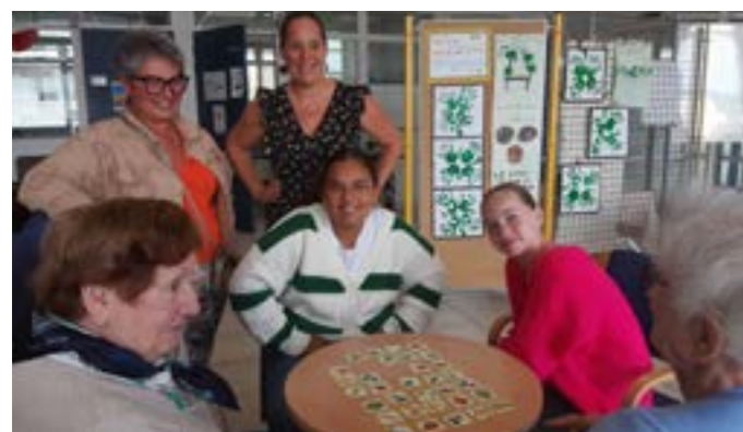
Jeux intergénérationnels avec la maison de la jeunesse