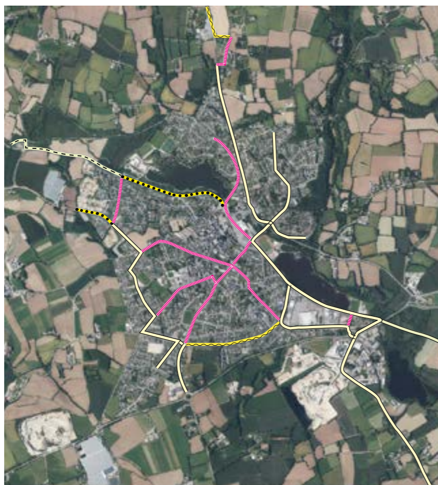
SCHÉMA COMMUNAL VÉLO