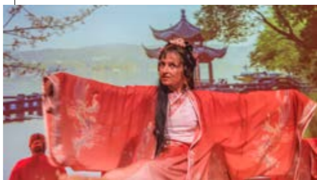
Exposition "les galas de la danse de juin 2023"

SAINT RENAN ACTUALITÉS N°531 - NOVEMBRE 2023 | Vie associative