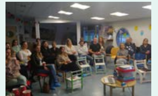
Le café des parents

Les enfants sont incités à manipuler, goûter, sentir et découvrir divers aliments : un vrai régal !