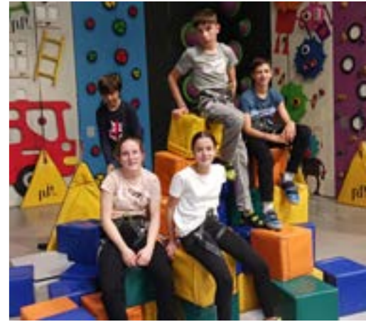
Les jeunes à l'escalade

Nous aurons plaisir à retrouver les jeunes à la Maison de la jeunesse les mercredis après-midi dès le mercredi 8 novembre et également lors des prochaines vacances du 2 au 5 janvier 2024.