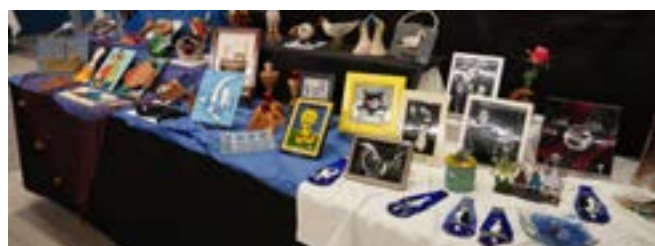
19 ème édition des Talents d'Iroise

Vous pourrez y apprécier des œuvres dans de nombreux domaines artistiques tels que la peinture, le vitrail, la sculpture, la poterie, l'ébénisterie, la peinture sur soie, le fusing, la couture et dans de nombreux autres domaines.