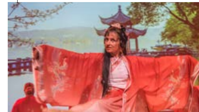
Exposition "les galas de la danse de juin 2023"