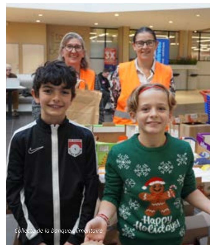
Collecte de la banque alimentaire

Chaque année depuis 1991, le CCAS organise, en partenariat avec la CCPI, une collecte de denrées non périssables en faveur de la banque alimentaire.