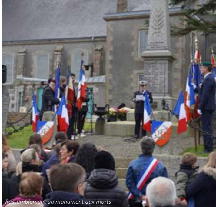
Rassemblement au monument aux morts

Au monument aux morts, Monsieur le Maire a partagé le message de Patricia Miralles, secrétaire d'État aux anciens combattants. Les noms des 73 Renanais tombés entre 1914 et 1919 ont été énoncés et la cérémonie s'est conclue par le ravivage de la flamme et le chant "Sauver le Monde" interprété par le Conseil Municipal des Jeunes.