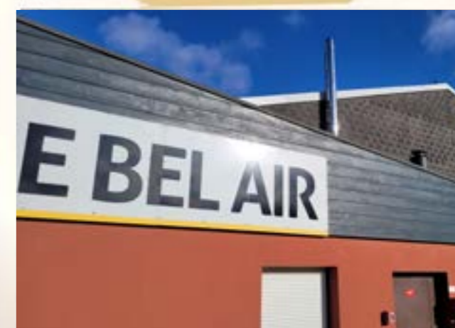
RAVALEMENT DU BARDAGE Salle Bel-Air