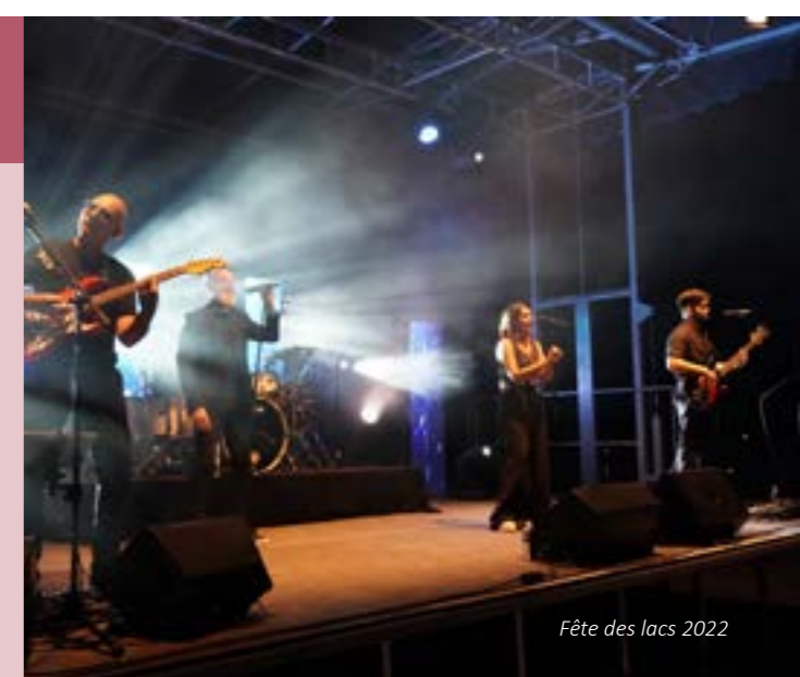
Fête des lacs 2022