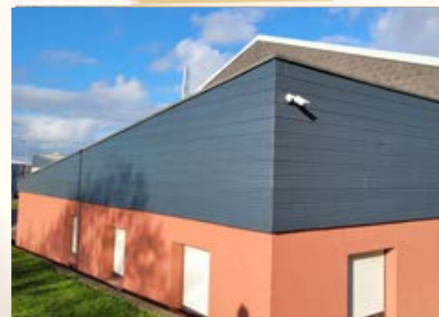
RAVALEMENT DU BARDAGE Salle Bel-Air