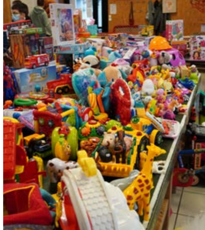
Collecte de jouets 2021