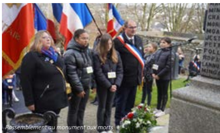
Rassemblement au monument aux morts