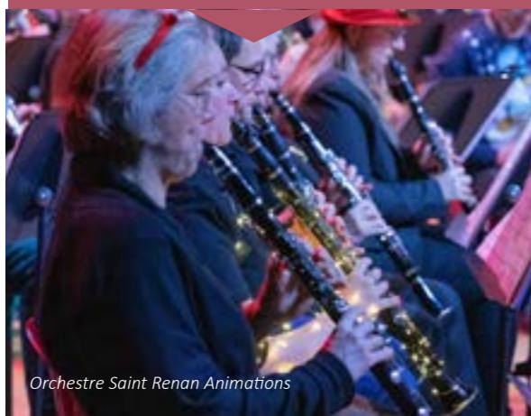
Orchestre Saint Renan Animations

Les répétitions sont ouvertes à tout le monde, si vous souhaitez les rejoindre, vous pouvez les contacter au 06.74.11.45.91 ou par mail : philippe.gouret@ccpi.bzh