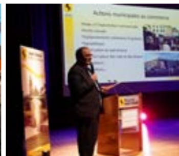
Au personnel communal

Ces vœux sont des moments privilégiés qui permettent de rencontrer les acteurs du territoire et la population. Ce sont des moments de partage et d'échanges enrichissants.