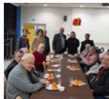
Vœux aux résidents des maisons de retraite