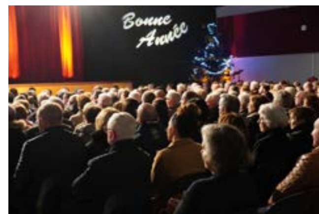
Vœux à la population

Plus de 500 habitants, institutionnels, élus et chefs d'entreprise se sont déplacés pour visionner un film retraçant les points forts de l'année écoulée et écouter le Maire dresser le bilan des actions et des travaux menés par la municipalité en 2023 et tracer les grandes perspectives pour 2024.