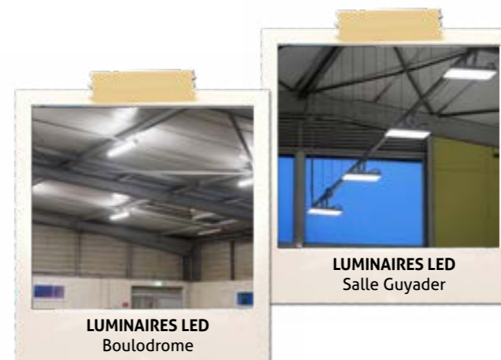
LUMINAIRES LED Boulodrome