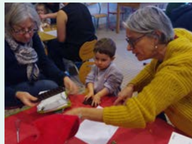
Atelier pâtisserie à la crèche

SAINT RENAN ACTUALITÉS N°534 - FÉVRIER 2024 | Jeunesse et crèche