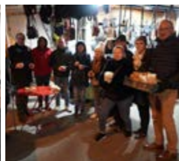
Vœux aux commerçants