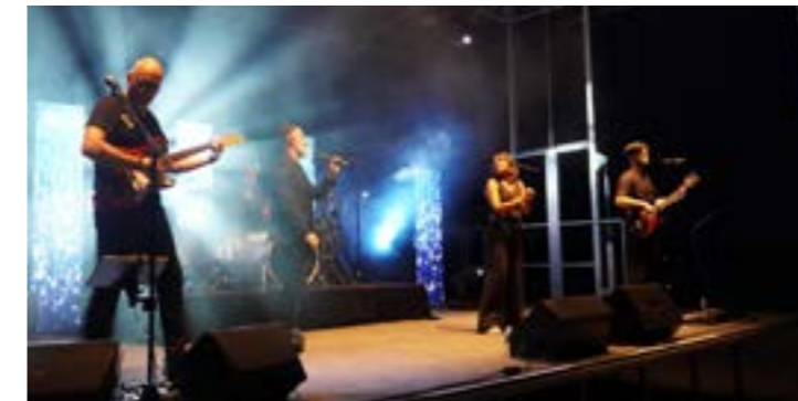
Le groupe Showyz lors de la fête des lacs 2022

Trois jours dédiés à la joie et à la convivialité, où vous pourrez vous réunir en famille ou entre amis pour partager des moments mémorables. La programmation festive, fera de cet événement l'un des rendez-vous incontournables de la saison estivale !