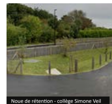
Noue de rétention - collège Simone Veil