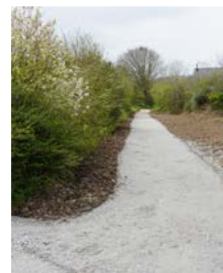
Nouveau sentier qui borde la rue du Jura