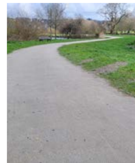
Ressablage des chemins autour des lacs