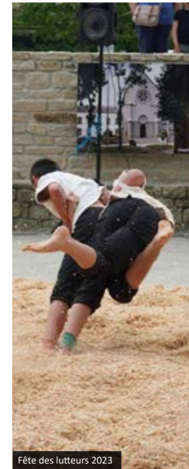
Fête des lutteurs 2023

Pour que la fête soit pleine, des musiciens feront danser les spectateurs et des jeux bretons seront en libre service. Ce sont tous les pans de la culture bretonne qui seront mis à l'honneur.