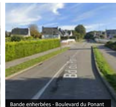
Bande enherbées - Boulevard du Ponant