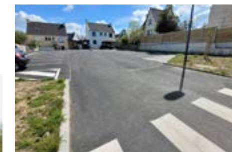
Réfection complète de la voirie Place des Rosiers