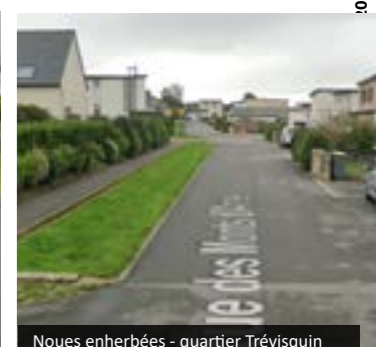
Noues enherbées - quartier Trévisquin