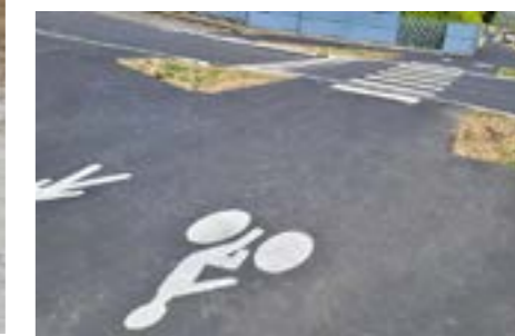
Réfection complète de la voirie avec piste cyclable Rue du Moustier