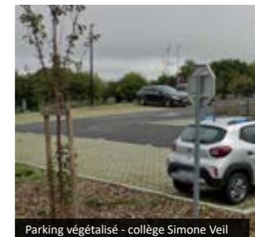
Parking végétalisé - collège Simone Veil